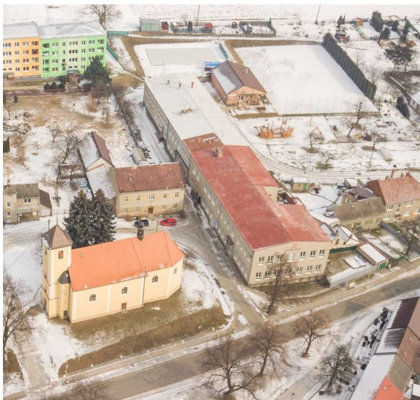
Letecký záběr budovy školy a okolí